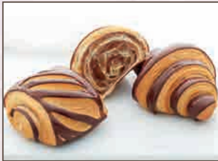
Pain au chocolat & croissant chocolat