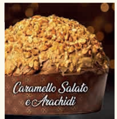
Caramello Salato e Arachidi