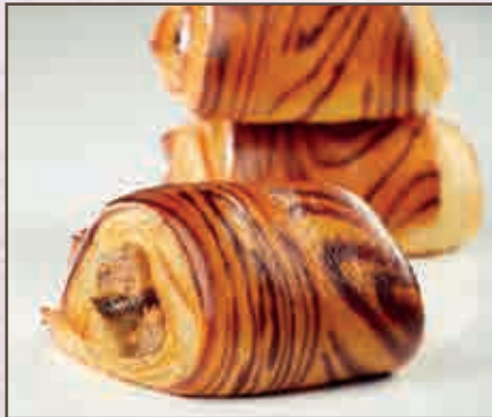
Pain au chocolat nocciola