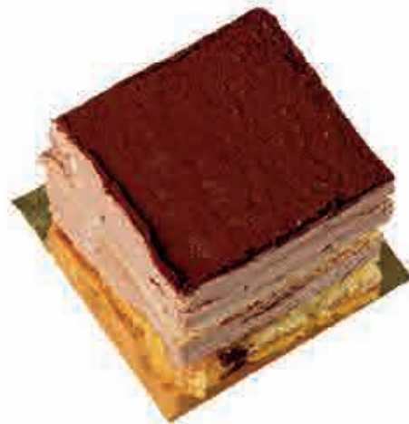
CIOCCOLATO E RUM