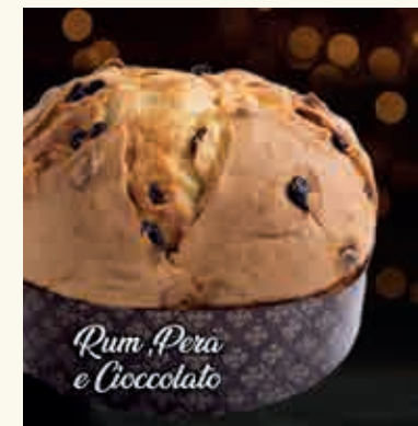
Rum Pera e Cioccolato