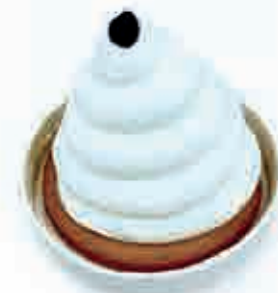
RICOTTA E PERA