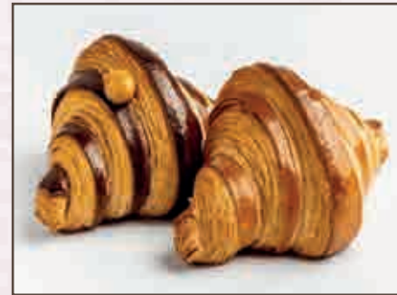
Croissant nocciola e croissant vuoto