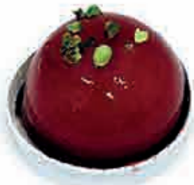
AMARENA E PISTACCHIO