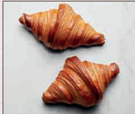
Croissant crema amarena