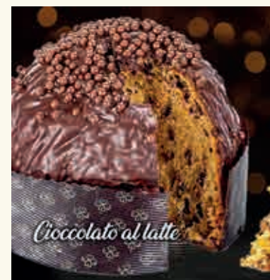
Cioccolato al latte