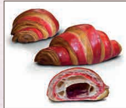
Croissant frutti di bosco