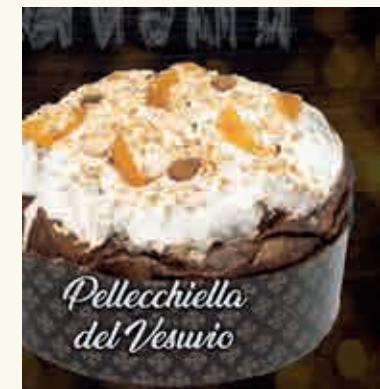
Pellicchiella del Vesuvio