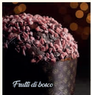
Frutti di bosco