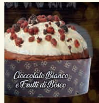
Cioccolato Bianco e Frutti di Bosco