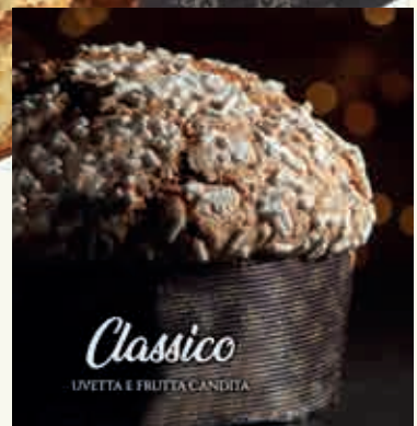
Classico UVETTA E FRUTTA CANDITA