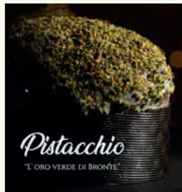
Pistacchio "L'ORO VERDE DI BRONTE"